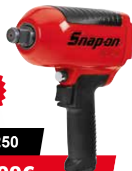
3/4" MG1250 450,00€