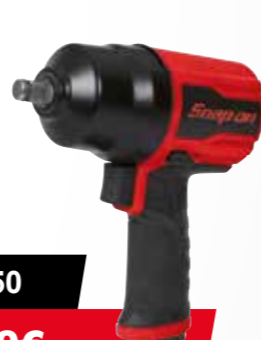
1/2" PT850 279,00€