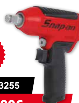
1/2" MG3255 229,00€